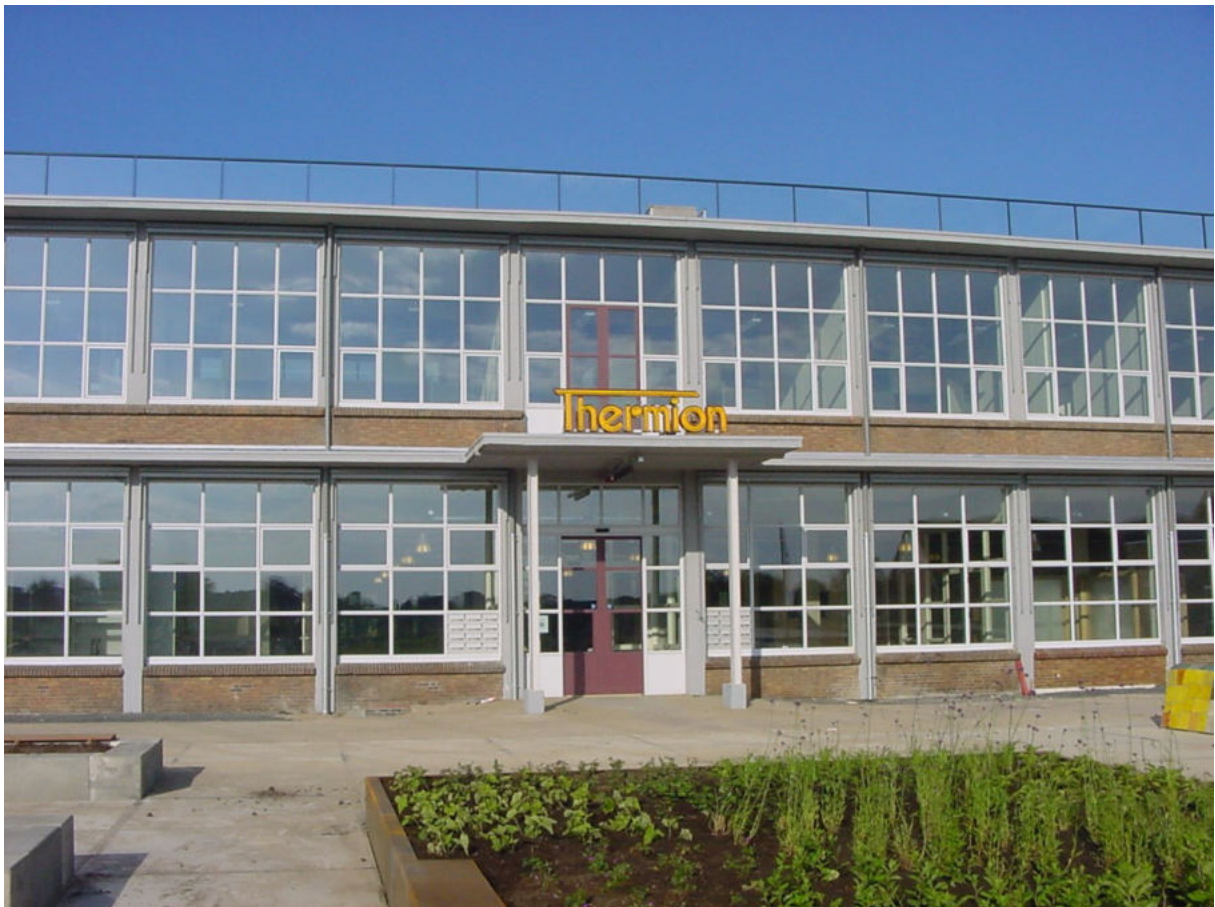
8 september 2012